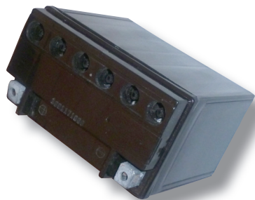
Příklad VRLA gelového akumulátoru s přetlakovými ventily

Přetlakové ventily nejsou určeny k tomu , aby s nimi bylo manipulováno a neslouží k doplňování elektrolytu dovnitř akumulátoru a zároveň jimi nemůže dojít k úniku elektrolytu při převržení akumulátoru. Skrz ventily nemůže dojít k vniknutí okolního vzduchu do akumulátoru.